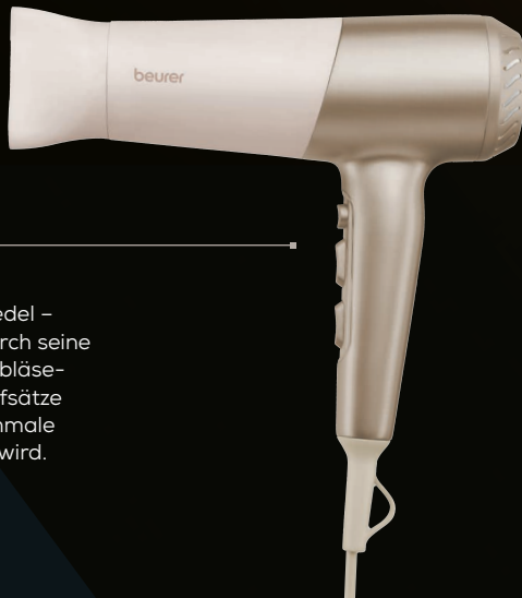
HC 70 - Haartrockner

Haarstruktur-Highlight Puristisch, modern und edel – ein Haartrockner, der durch seine 3 Temperatur- und 2 Gebläsestufen sowie seiner 2 Aufsätze Volumendiffusor und schmale Profidüse zum Highlight wird.