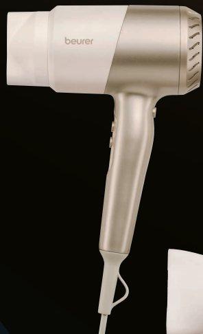
HC 40 - Kompakthaartrockner

Die Produkte bestechen durch ihr elegantes, einheitliches Design in mattem Beige und metallischem Gold und sind somit ein echter Hingucker in jedem Badezimmer.