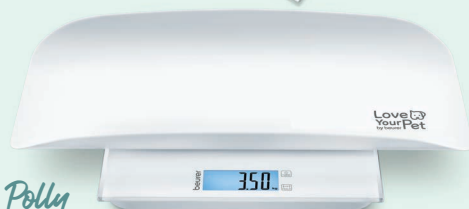
Polly PP 170 - Multifunktions-Haustierwaage Art.-Nr.: 105.37