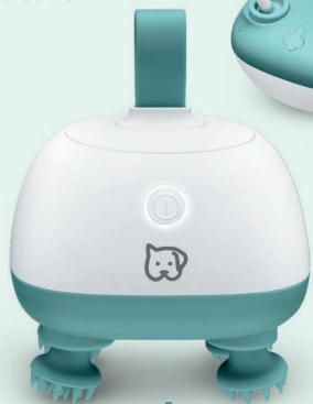
Buddy PP 410 - Massagegerät Art.-Nr.: 105.24